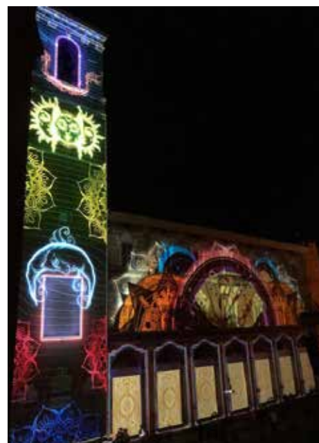
Mapping vidéo architectural réalisé par le Centre des arts et projeté à Fabriano en Italie.

(Palais ducal d'Urbino), une ville durable, une société bien ordonnée à la lumière de son architecture, métaphore d'une bonne planification urbaine et d'une bonne gouvernance. Pour la cérémonie d'ouverture de cette XIII e conférence annuelle, les compétences artistiques et l'ingénierie culturelle d'Enghien-les-Bains ont été mobilisées pour la réalisation d'une projection monumentale sur la façade du Palazzo Vescovile et de la Torre Civica, célébrant le savoir-faire artisanal de Fabriano et celui des 14 villes créatives des arts numériques. Un mapping invitant à la réflexion sur notre vision contemporaine d'une humanité durable.