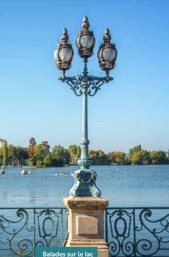
Balades sur le lac