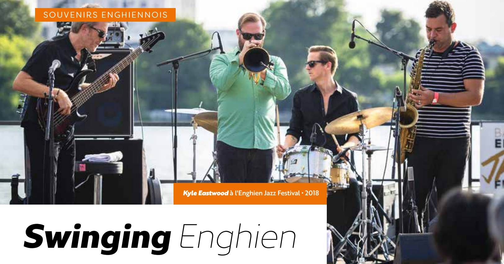
Kyle Eastwood à l'Enghien Jazz Festival - 2018