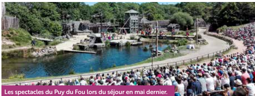
Les spectacles du Puy du Fou lors du séjour en mai dernier.

+ Renseignements sur les actions annuelles des Nouvelles Solidarités au 01 34 28 67 36. Inscriptions dans la limite des places disponibles.