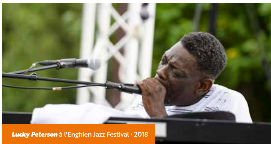
Lucky Peterson à l'Enghien Jazz Festival • 2018

succès a été à la hauteur », confie Blandine Harmelin. Macéo Parker inaugure alors la majestueuse scène flottante de 400m 2 , l'une des plus grandes d'Europe. Légende vivante du funk, le saxophoniste se produira à nouveau en 2019 à l'ouverture de la 20 e édition.