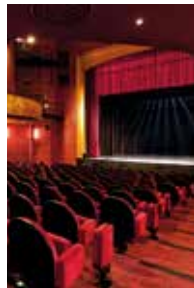
Le Théâtre du Casino