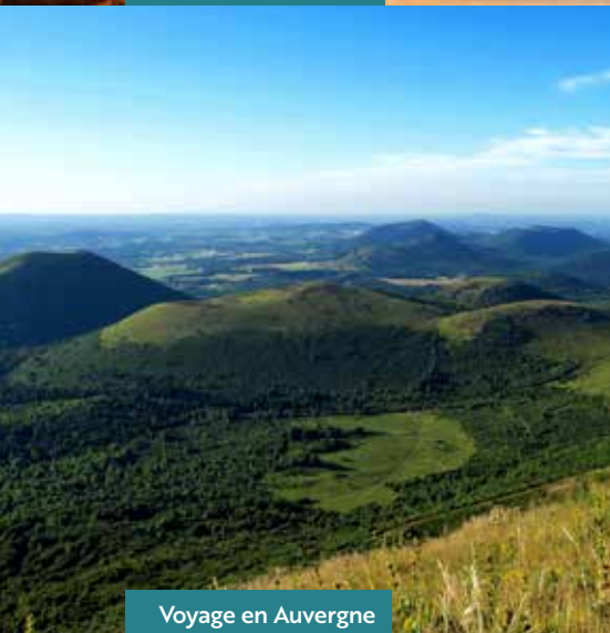
Voyage en Auvergne