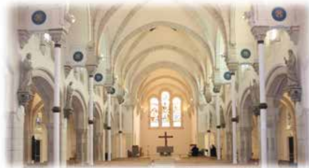
Rénovation d'éclairage LED

ELECTRICITE GENERALE COURANTS FORTS & COURANTS FAIBLES BATIMENT - ECLAIRAGE PUBLIC