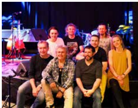
Les professeurs de musique et de danse