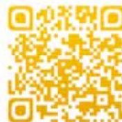
Lac en scène

Plus de 20 000 visiteurs ont foulé la jetée du lac pour écouter le concert de Yannick Noah, suivi d'un grand feu d'artifice haute couture, sur le thème des comédies musicales. Une soirée incroyable acclamée par le public et sur les réseaux sociaux. Retrouvez ici par ces QR codes la vidéo de la soirée et aussi celle du montage de la scène flottante, la plus grande d'Europe.