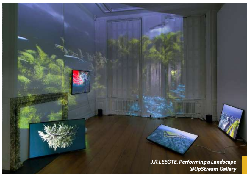
J.R.LEEGTE, Performing a Landscape

Atelier artistique pour les 6-12 ans le mercredi 21 octobre de 14h30 à 17h