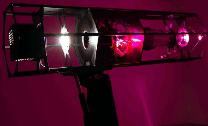
N.ASSMANN, The Abysses of the Scorching Sun