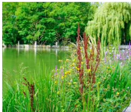
Les plantes de la jetée Tabarly arrosées à l'eau du lac, grâce à une motopompe thermique.

La rénovation de l'Office de Tourisme est désormais terminée. Ce nouvel écrin lumineux a été entièrement réaménagé pour le plus grand confort des visiteurs.