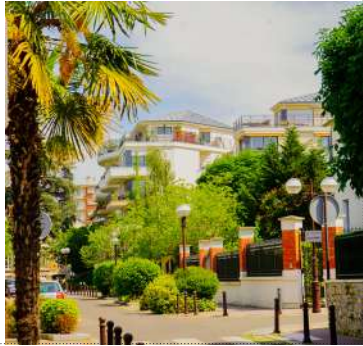
© F. Brsisteux / E. Chidiack / N. Laverroux